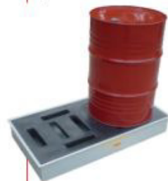
170x1250x650mm Pallet 2 tambor Baixo perfil Polietileno Cód. TK14105 Aço Cód. TK14106