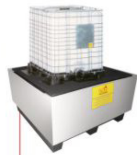
1500x1500x1000mm Pallet para IBC'S Material: Polietileno Cap. Contenção: 1600 litros Cód. TK4070