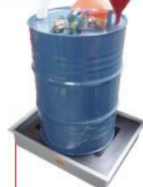
170x650x650mm Pallet 1 tambor Baixo perfil Polietileno Cód. TK14101 Aço Cód. TK14103