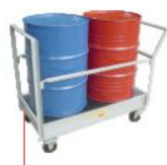
300x1250x650mm Carro Pallet p/ 2 tambor com barras protetoras laterais removíveis Aço Cód. TK14111