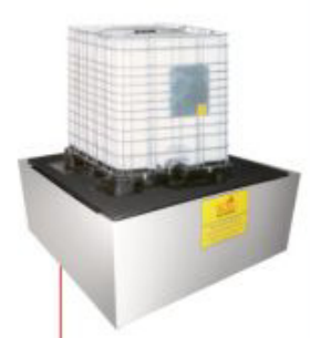
1500x1500x800mm Pallet para IBC'S Material: Polietileno Cap. Contenção: 1600 litros Cód. Tk4050