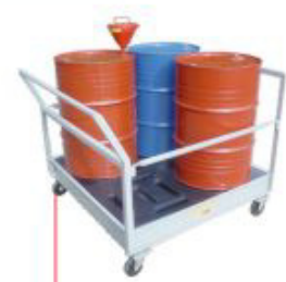
300x1250x1250mm Carro Pallet p/ 4 tambor com barras protetoras laterais removíveis Aço Cód. TK14112